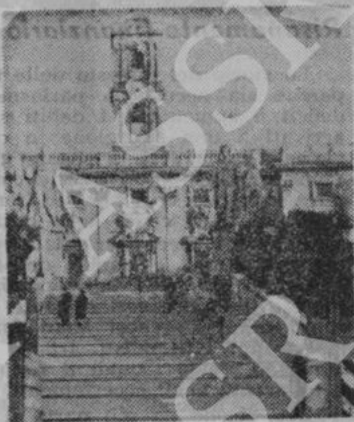
Il Campidoglio sia centro di vita democratica

Consiglio sarebbero sottoposte all'approvazione preventiva del ministro dell'Interno, assistito da una speciale commissione consultiva nominata dall'alto e composta da elementi dell'alta burocrazia, staccati dalle esigenze più vive della popolazione e all'infuori di ogni controllo cittadino. Verrebbe sottratta tra l'altro, alla diretta ed esclusiva competenza dell'organo elettivo, la possibilità di contrarre mutui importanti, di municipalizzare i pubblici servizi, di emanare i regolamenti per le aziende municipalizzate, di aprire e creare nuove strade e nuove istituzioni pubbliche, ecc.