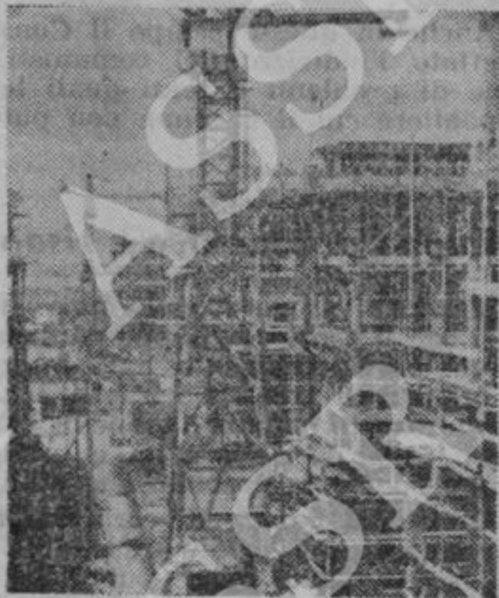
Case per tutti: una necessità imprescindibile

La legge speciale dei comunisti prevede una serie di misure per la costituzione di scuole e di ospedali, indicando anche i mezzi di finanziamento necessari.