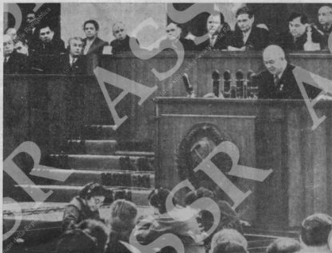
Il compagno Khrustelov alla tribuna del Congresso.

...La maggioranza dei nostri propagandisti conosce poco i problemi economici della produzione socialista. I propagandisti sono spesso diretti ed educati da uomini che non conoscono nemmeno loro la produzione o che ne hanno solo un'idea superficiale. Come uscire da questa situazione? Per uscirne è necessario mobilitare con decisione