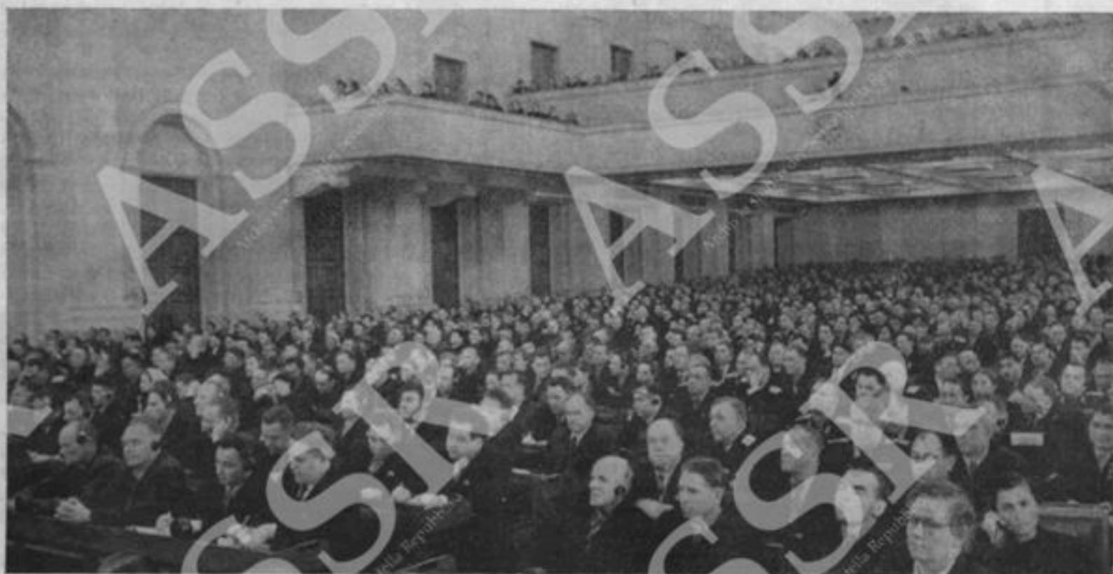
Un aspetto della sala durante i lavori del XX Congresso del PCUR.

si sfruttatrici e, di conseguenza, da un'aspra lotta rivoluzionaria della classe operaia. Nello stesso tempo in alcuni altri paesi capitalistici, dove le forze reazionarie e l'apparato poliziesco-militare sono meno forti, non è esclusa la possibilità di uno svolgimento pacifico della rivoluzione nel passaggio al socialismo. Non è esclusa, tra l'altro, la possibilità di un avvento pacifico della classe operaia al potere attraverso la conquista della maggioranza parlamentare e la trasformazione del parlamento in un autentico parlamento popolare. Un tale parlamento, che poggi sul movimento rivoluzionario di massa del proletariato, dei contadini lavoratori, degli intellettuali e di tutti gli strati progressivi della popolazione, potrà spezzare la resistenza delle forze reazionarie e attuare la trasformazione socialista della società.