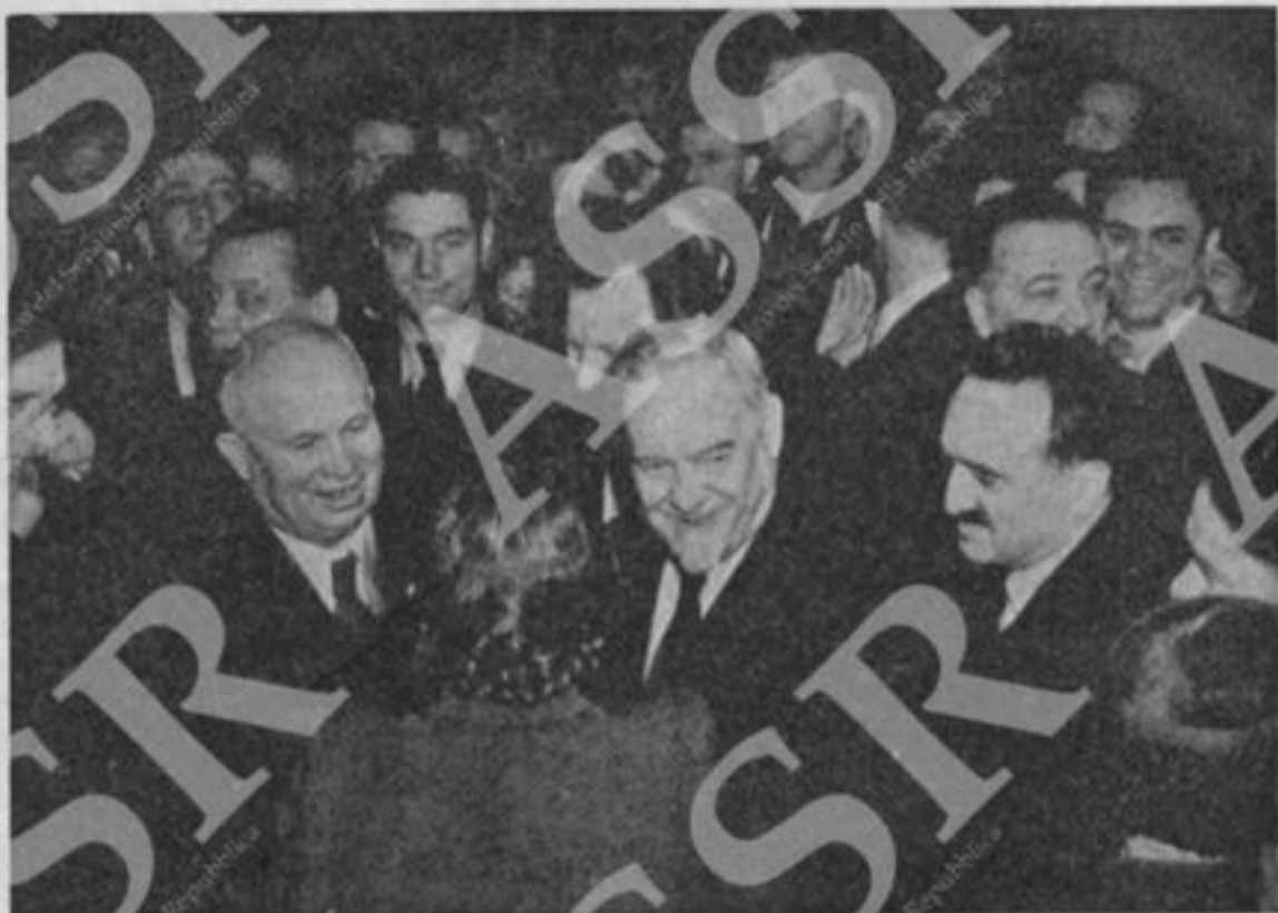
Khrustiov, Bulganin e Mikolaj, in un intervallo del Congresso, discorrono con alcuni delegati.

In rapporto al problema della coesistenza bisogna soffermarsi brevemente sul commercio internazionale. Gli americani sono oggi prigionieri di una loro menzogna, secondo cui, se si limitasse il commercio con i paesi del socialismo, si potrebbe in qualche modo frenare lo sviluppo dell'Unione sovietica, della Cina e degli altri paesi di democrazia popolare. A questa storiella credono in pochi oggi, anche in Occidente; tutti comprendono che l'economia mondiale socialista produce tutto ciò di cui abbisogna, sia riguardo ai tipi fondamentali di prodotti, sia per il volume delle attuali esigenze dei paesi del campo socialista. Ne risulta, per esempio, che i paesi occidentali, legati mani e piedi dal divieto di commerciare con la Cina, si