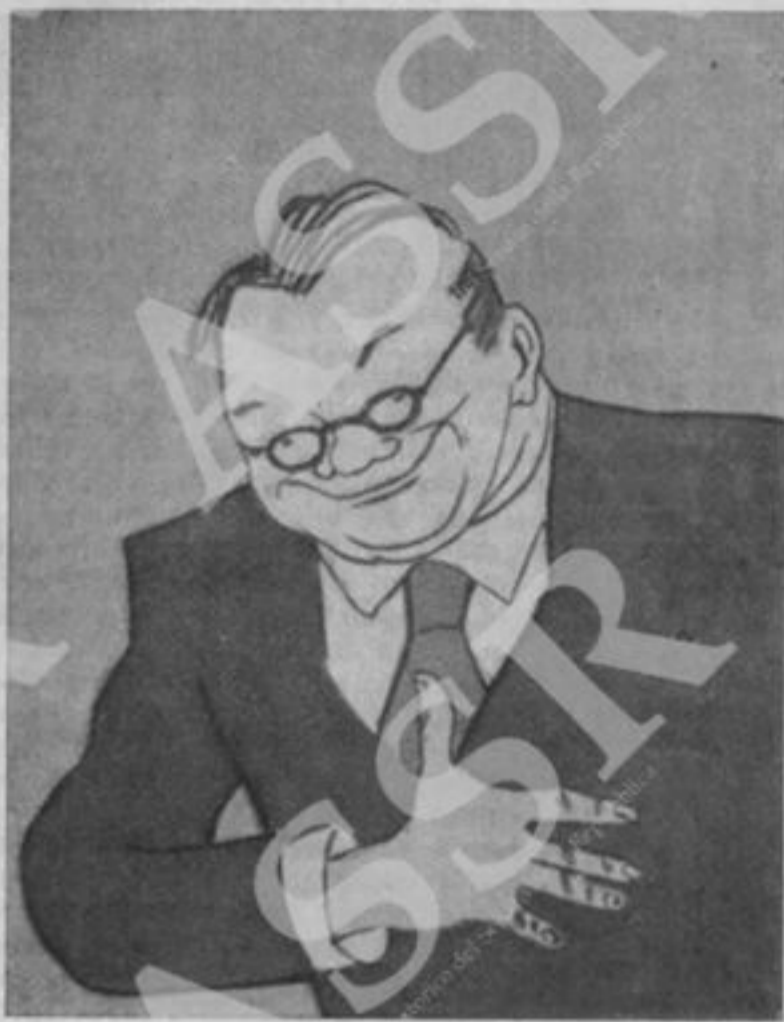
(Dal Krokodil , n. 2, febbraio 1956) Prima delle elezioni...

Il finanziari nazionali, l'imperialismo dovrà inevitabilmente crollare, il capitalismo si trasformerà nel suo opposto» ( Opere , vol. XXII, pag. 94-95, ed. russa).