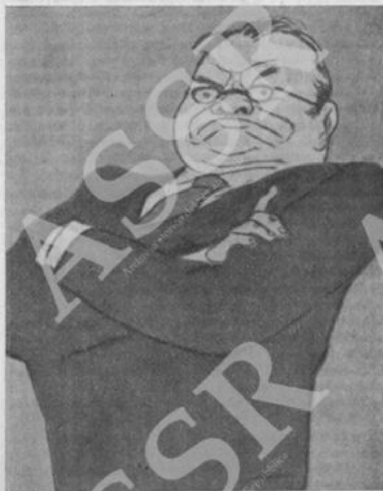
(Dal Krokodil, n. 2, febbraio 1956) ... e dopo le elezioni.

Gli ideologi borghesi cercano di confutare la deduzione marxista sulla tendenza alla decomposizione del capitalismo richiamandosi al fatto che ora si osserva una nuova fase nello sviluppo della tecnica: apparizione dell'energia atomica, automatizzazione della produzione, inizio dell'impiego delle macchine calcolatrici elettroniche. Ma, in primo luogo, i marxisti non hanno mai ridotto il problema della decomposizione del capitalismo alla questione dello stato della tecnica e, in secondo luogo, non hanno mai ritenuto che sia giunto il momento in cui si produce la saturazione delle forze produttive del capitalismo, in cui la tecnica non abbia più assolutamente alcuna possibilità di sviluppo. Le teorie della stagnazione del capitalismo e della saturazione delle forze produttive sono estranee alla dottrina del marxismo. La teoria leni-