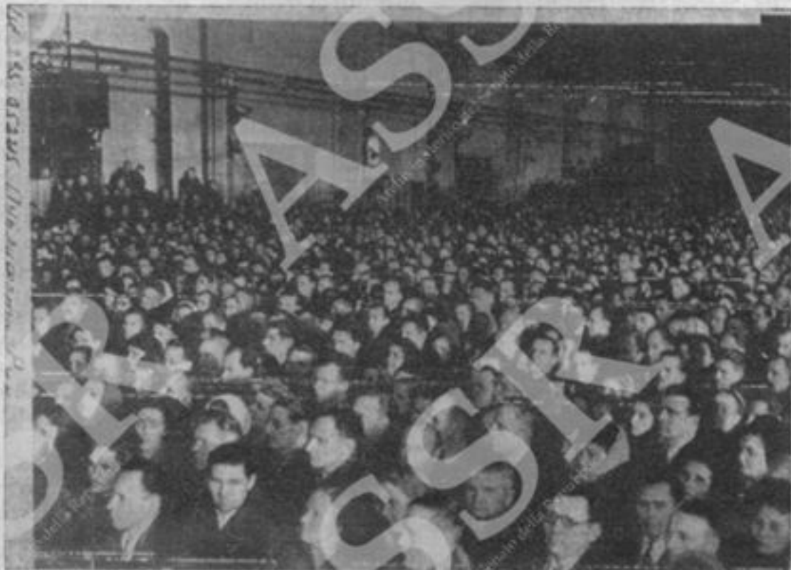
Gli operai dell'officina « Stalin » di Mosca ascoltano il discorso del compagno Togliatti.

In pari tempo noi comprendiamo che questa