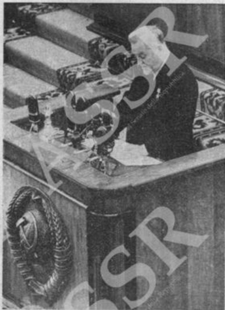
Il compagno Bulganin svolge il rapporto sul VI piano quinquennale.