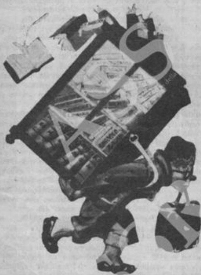
(Dal Kronos, n. 1, gennaio '56)

Questo, per sommi capi, il panorama del modo come la stampa estranea al movimento operaio ha seguito i lavori del congresso del PCUS. Due rilievi immediati esso suggerisce: da una parte la constatazione, accennata all'inizio, che il tentativo del Popolo e del Quotidiano di tenere il dibattito entro gli schemi tradizionali dell'anticomunismo più gretto, non ha resistito alla prova dei fatti, e certe verità sono venute fuori. Il che è segno evidente del logoramento di questi schemi entro i quali per tanti anni è stata tenuta in Italia la polemica anticomunista. Il secondo rilievo è che è difficile ritenere concluso il dibattito, almeno da parte della pubblicistica più avvertita del nostro paese. Fino a ieri si poteva rimanere in attesa di prendere visione diretta dei discorsi e dei documenti. Ora che questa lacuna è stata colmata, attendiamo di poter riprendere il dibattito, per approfondirlo e portarlo innanzi.