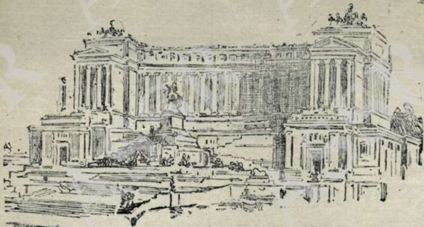
COME SARÀ IL MONUMENTO

Innanzi tutto noi ci troviamo di fronte ad un monumento che non è nè romano nè greco, è la fusione delicata e completa di mille elementi fioriti nella nostra terra, la vera sintesi di tutte le grazie che nacquero dalle nozze del genio latino con la cultura ellenica, vi sono dei tratti della fierezza romana, della severità degne della pensosa e misteriosa Etruria, e tutto ciò è armonizzato e fuso nella schietta e robusta grazia del rinascimento.