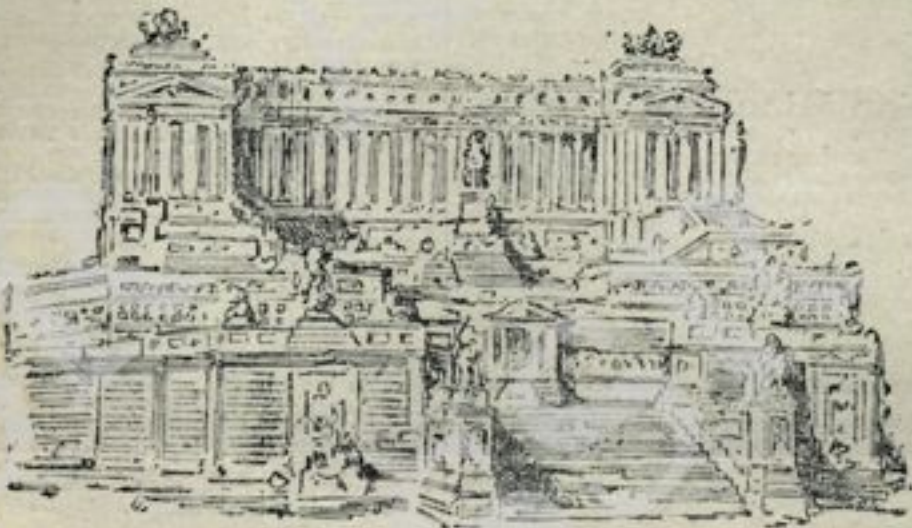
Bozzetto di Concorso

In questi nostri rapidissimi cenni dobbiamo