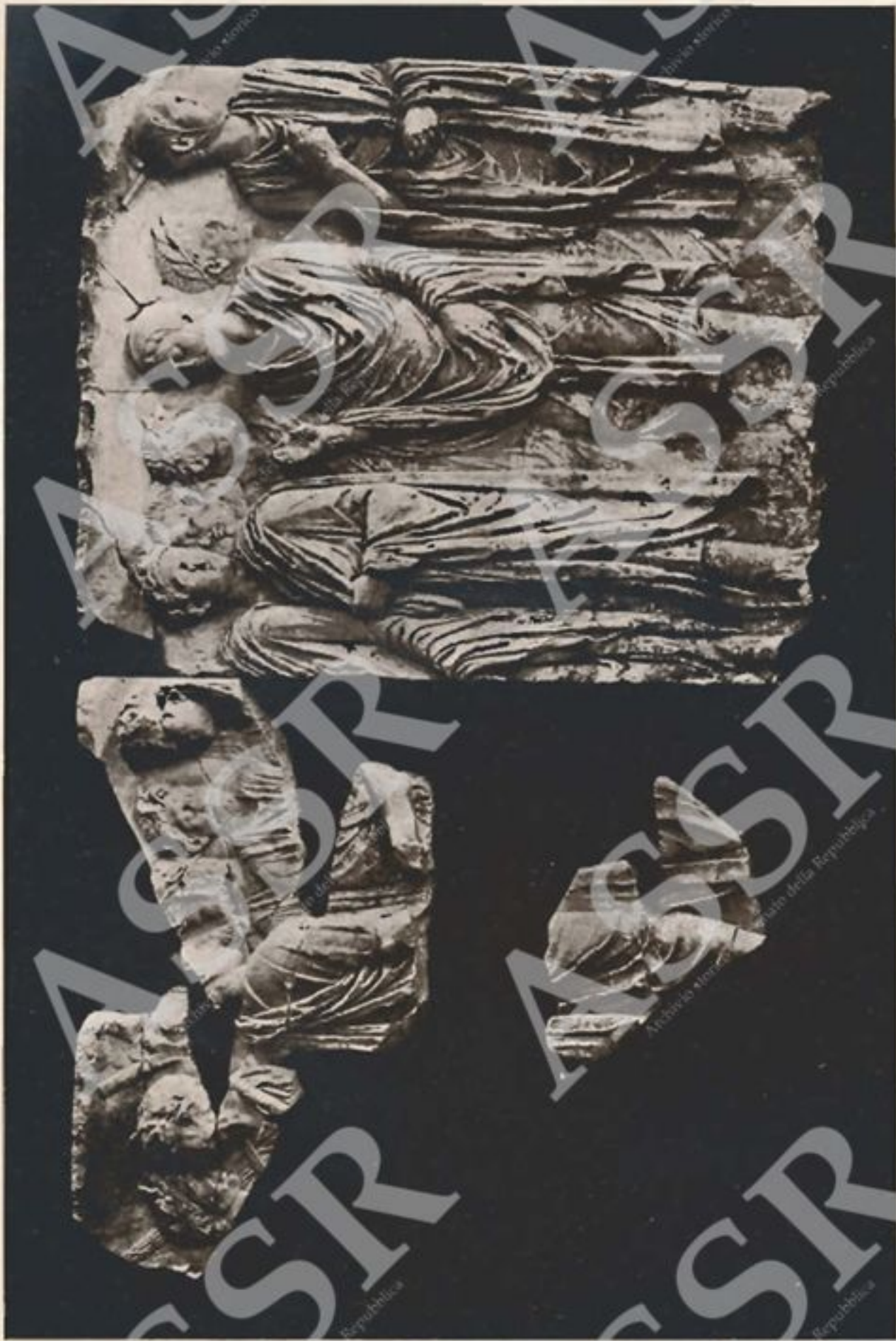
ROMA - Frammenti dell'Ara Pacis Augustae.