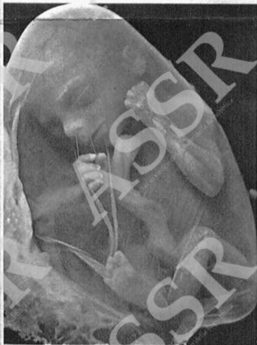
E' un bambino concepito da 4 mesi ● è alto 16 centimetri ● produce saliva ● piange ● punta i piedi e stringe le mani per afferrare.