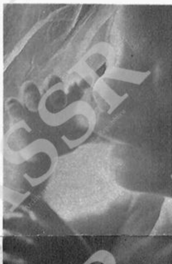
E' un bambino di 5 mesi fotografato nel seno materno mentre si succhia il dito ● gli crescono capelli e sopracciglia ● ha una vigorosa attività ● si esercita per il suo futuro

Toglie dalla legge l'aborto libero. Nei casi di grave pericolo per la vita o la salute della donna l'aborto resterà possibile perché così ha deciso la Corte Costituzionale.