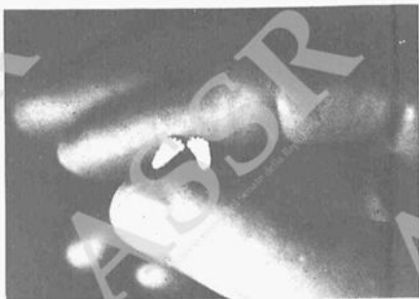
Piedini con le impronte digitali di un bambino concepito da poco più di 2 mesi.

QUESTA VOLTA CONTA LA TUA COSCIENZA PENSA E DECIDI CON LA TUA TESTA