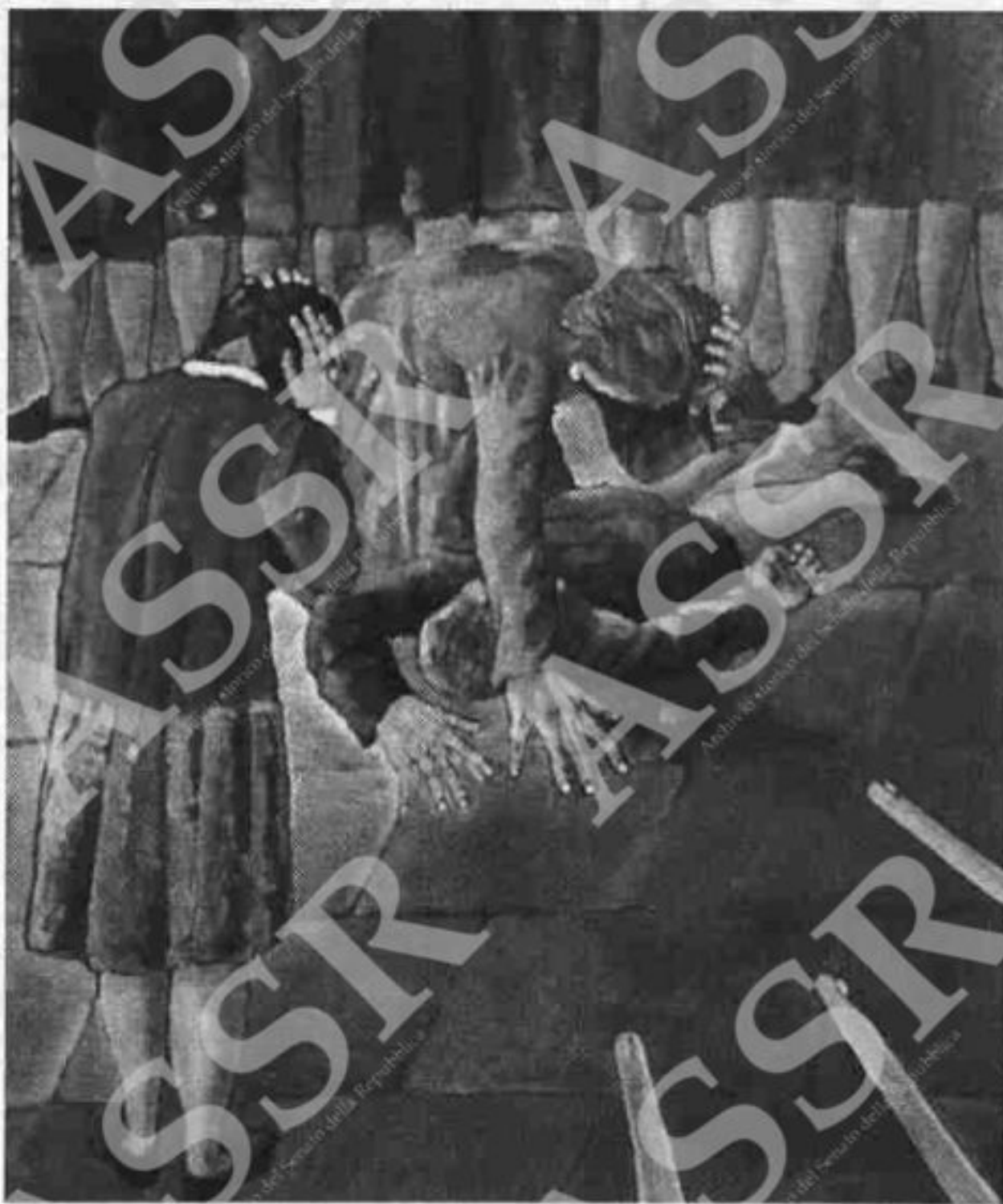
«IMOLA, 29 APRILE 1944» di G. MAEDDU