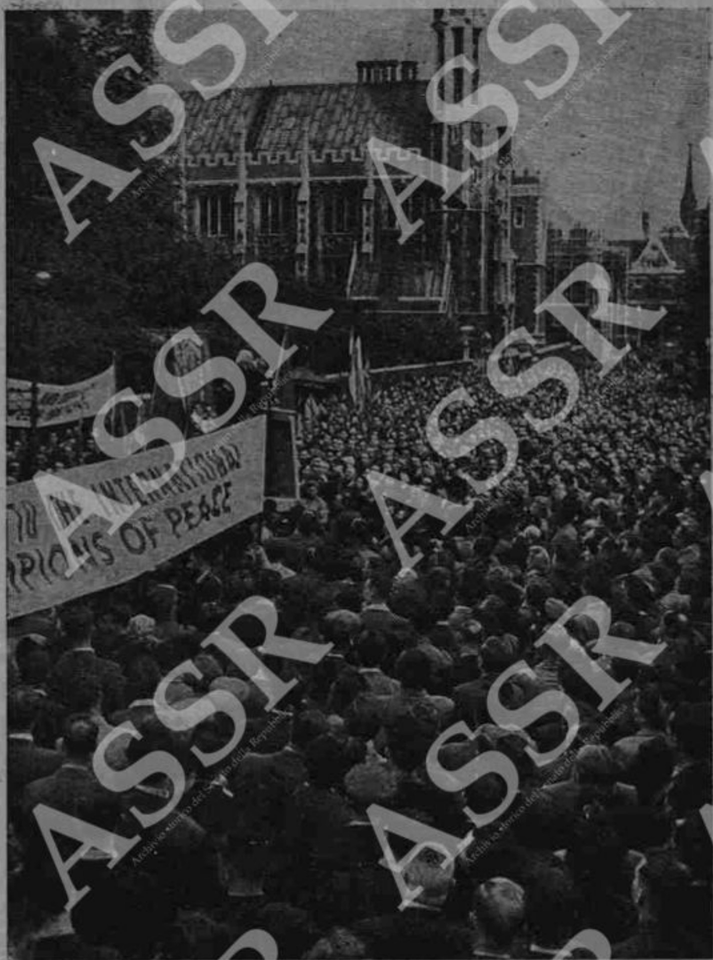
Il popolo inglese manifesta contro la guerra. Parla il Decano della Cattedrale di Canterbury.