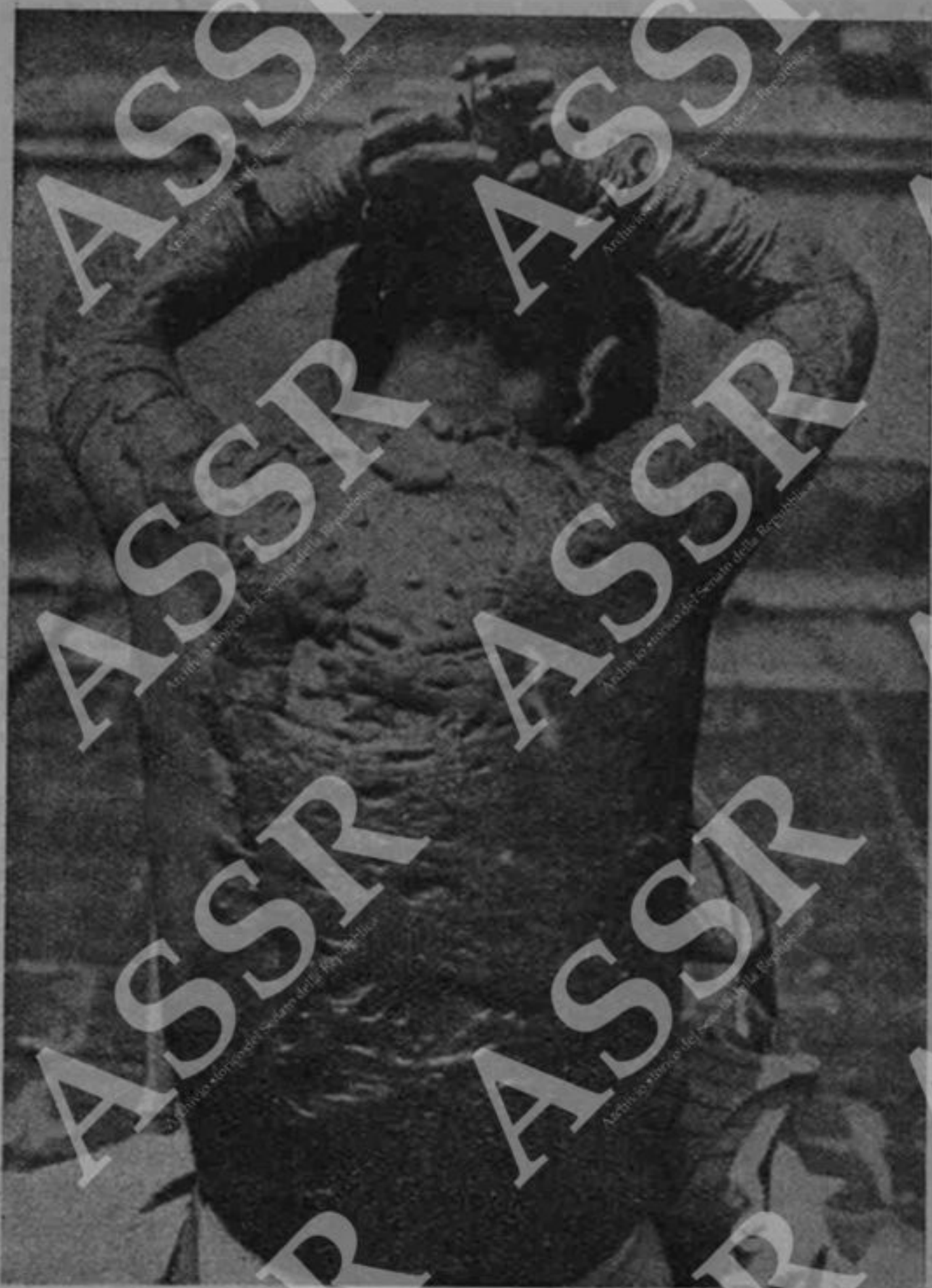
Questa fotografia è stata fatta 20 mesi dopo l'avvenuta esplosione dell'atomica su Hiroshima. La vampata di calore ha colpito il giovane alla schiena, mentre egli si trovava ad oltre tre km. di distanza dal luogo dove cadde la bomba.