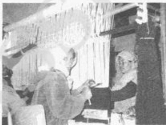
Donne Saharai alla tessitura