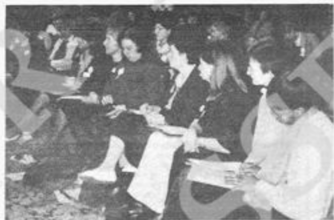
Sheffield. Sessione plenaria della Conferenza

privatizzazione dell'industria nazionale del gas è giusto l'argomento di questi giorni, fra la gente e sui giornali).