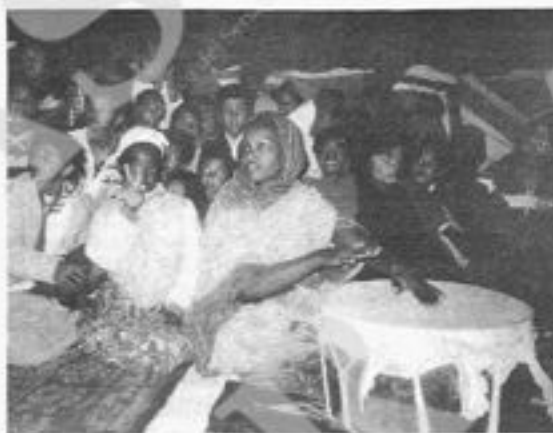
Benvenuto alle ospiti