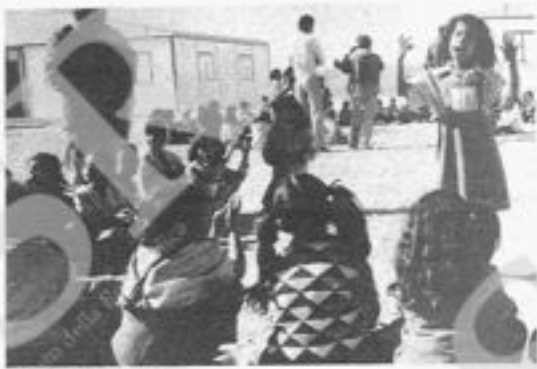
Bambini a El Ayoun

La prima domanda che pongo riguarda la storia organizzativa delle donne Saharai: