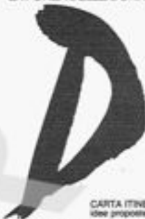
CARTA ITINERANTE idea proposte interrogativi

È stato riprodotto in volumetto il documento a cura della Sezione femminile della Direzione del PCI presentato nell'autunno scorso e che contiene una proposta di Carta delle Donne . Una proposta che non vuole presentarsi compiuta e definitiva, ma come è detto nella introduzione di Livia Turco - «vuole arricchirsi, modificarsi, riempire i suoi vuoti proprio attraverso il rapporto con le donne, la conoscenza dei loro problemi, l'ascolto delle loro proposte». La Carta , che «dovrà attivare un percorso di incontri e colloqui, di approfondimento delle questioni, di lotte e vertenze su obiettivi concreti» (e per questo è detta itinerante ) illustra le opzioni di valore, le scelte ideali, gli obiettivi immediati delle donne del PCI.