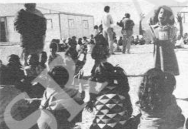
Bambini a El Ayoun

La prima domanda che pongo riguarda la storia organizzativa delle donne Saharai: