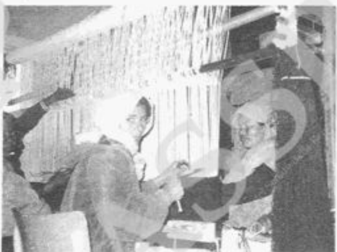
Donne Saharai alla tessitura