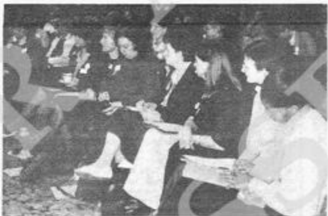
Sheffield. Sessione plenaria della Conferenza

«Immaginiamo quanti passi avanti potrebbe fare l'umanità se il denaro speso per l'industria bellica fosse speso a beneficio della gente. Potremmo avere tutti una vita decente, case confortevoli, buona istruzione e assistenza sanitaria, piena occupazione, una varietà di attività culturali e ricreative. La lotta è ancora lunga e difficile, ma se lavoreremo insieme, avremo una grossa chance per dare ai nostri figli e nipoti un mondo di uguaglianza e di pace».