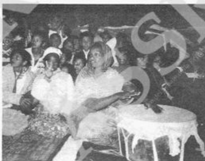
Benvenuto alle ospiti