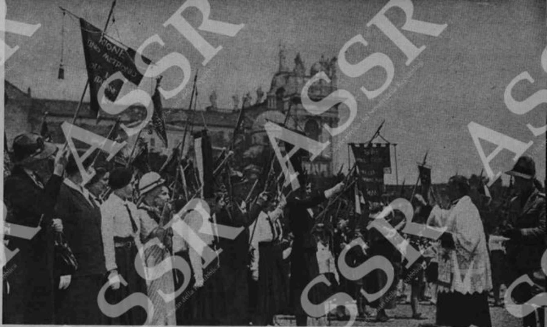
Benedizione dei gagliardetti dalle organizzazioni femminili fasciste. In basso: esercitazioni pratiche alla scuola di economia domestica di San Gregorio al Celio, a Roma. Questo tipo di scuole femminili furono le uniche potenziate dal regime fascista.