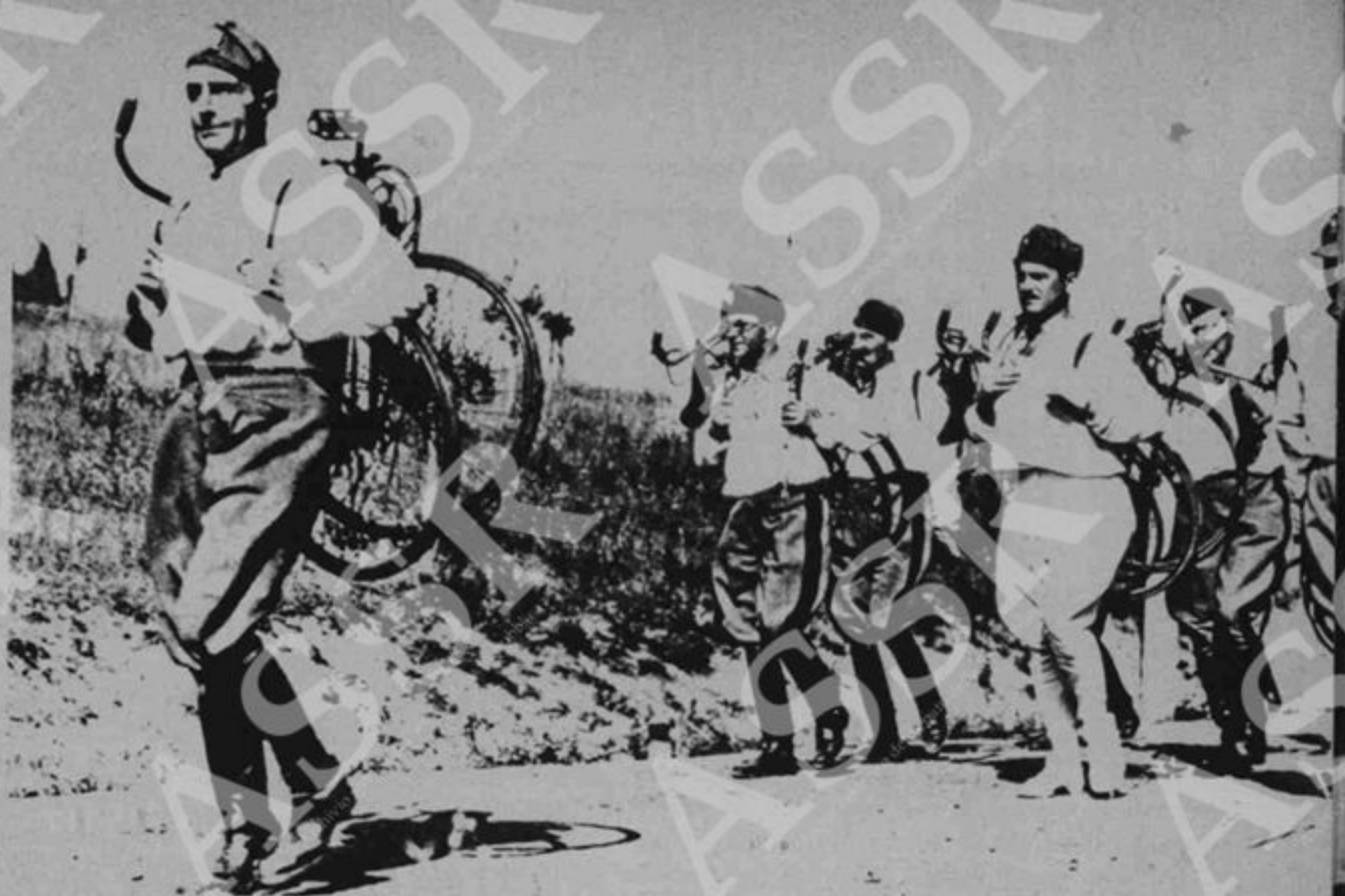
Simboli della « virilità guerriera » secondo la concezione fascista. Marcia di gerarchi — in testa Achille Starace, allora segretario del partito fascista — con la bicicletta in spalla, alla bersagliera. In basso: il passo romano di parata — invenzione personale di Mussolini — è adottato anche dalla polizia.