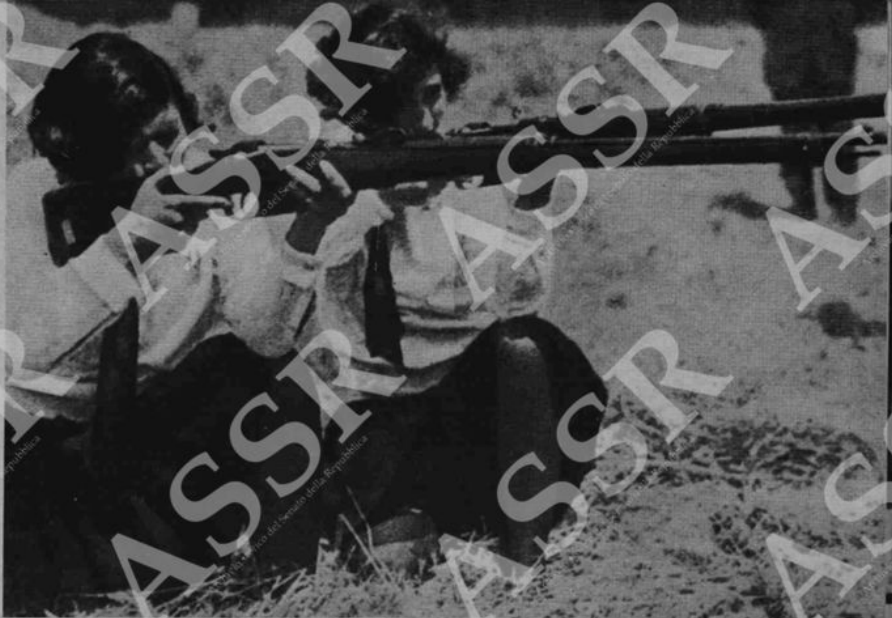
Esercitazione di giovani italiane, con il fucile modello 91. In basso: un premio per i benemeriti del regime, distintisi nella battaglia demografica o nella battaglia del grano: un diploma e un ritratto di Mussolini.