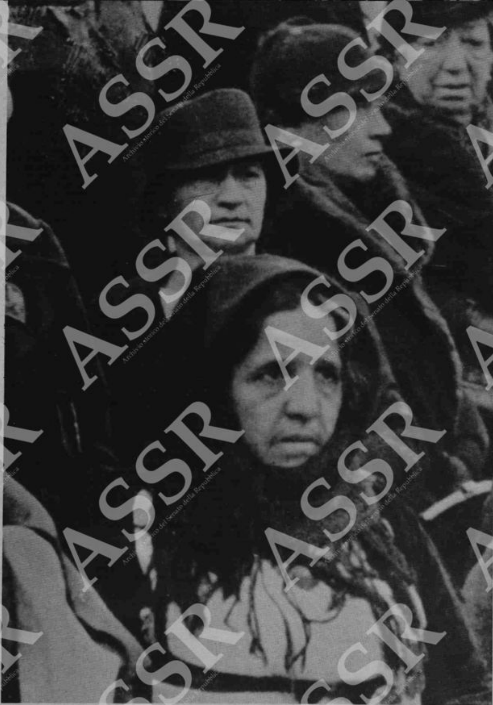
Una contadina, vedova di guerra, tra le gerarche del fasci femminili. La macabra ostentazione del lutto fu adottata a sistema dal fascismo e divenne la caratteristica di ogni cerimonia.