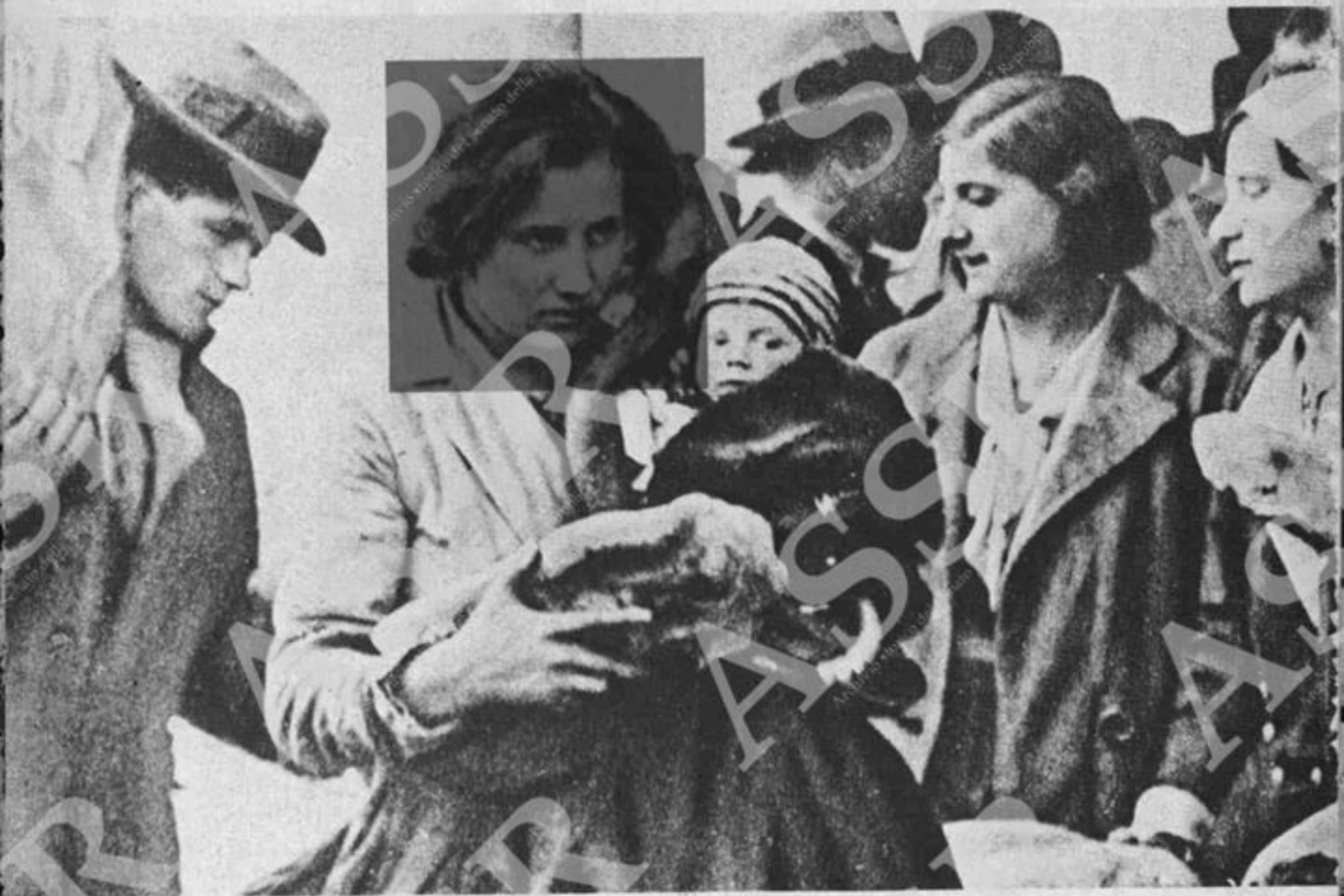
Distribuzione di pane agli emigranti che partono dalla Bassa Padana per i territori di bonifica dell'Agro pontino