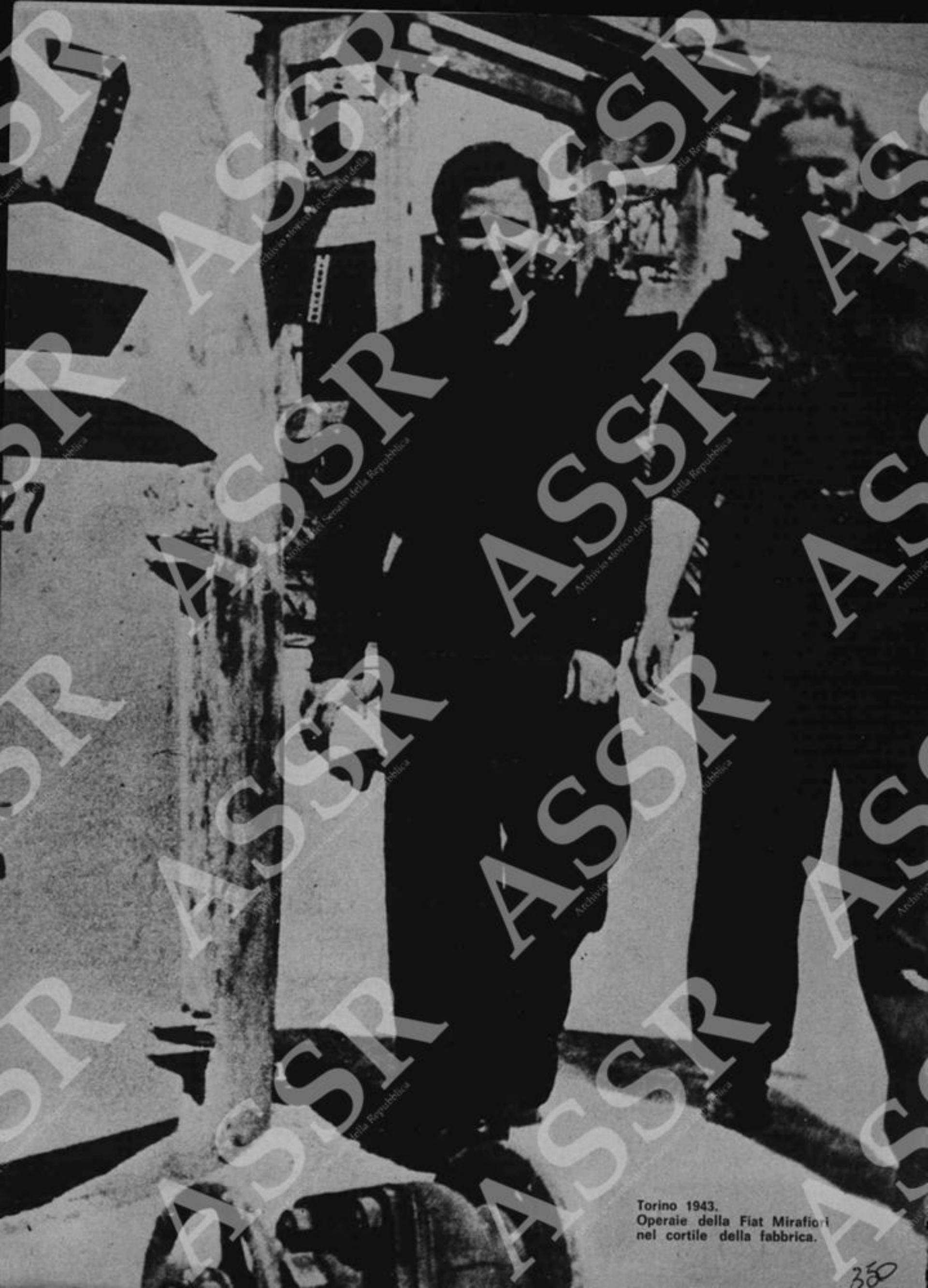
Torino 1943. Operaie della Fiat Mirafiori nel cortile della fabbrica.