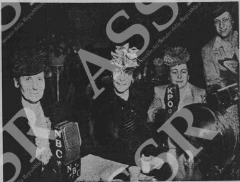
Da sinistra a destra: La signora Florence Horsburgh, sottosegretaria alla Salute Pubblica; Virginia Gildersleeve, delegata americana; Isabella Sanchez de Urdañeta e Caterina Sibley. Si riconosce la testa (che guarda verso le altre delegate) della dottoressa Wu-Yi-Fang, delegata cinese.

Questa riunione che non ha un carattere definitivo perchè vi mancavano le delegate di paesi che come l'Unione Sovietica hanno dato così largo contributo alla vittoria dei popoli liberi sul nazifascismo, è stata tuttavia utilissima perchè da questi scambi di esperienze, le donne potranno meglio organizzare un'azione comune per lo scopo comune a tutte: impedire che nuovi conflitti, nuove guerre criminali gettino di nuovo allo sbaraglio e alla morte le generazioni future, costruire una organizzazione che dia alle donne la sicurezza che le loro famiglie crescano per le feconde opere di pace, per la costruzione di una vita migliore.