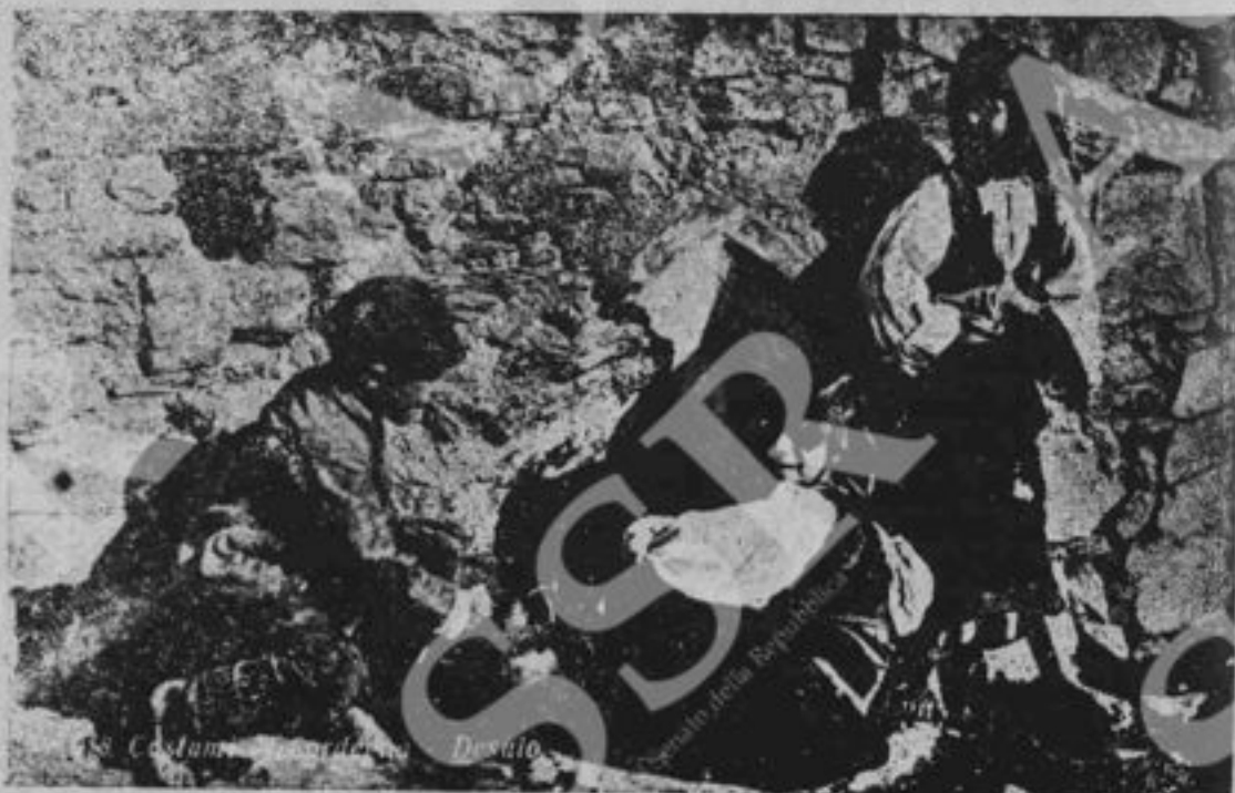
Migliaia di bambini in Sardegna giocano così scalzi al sole, nelle strade sporche. Perché ai loro bambini sorrida un avvenire felice le donne sarde vogliono lavorare e lottare unite alle loro sorelle del continente.