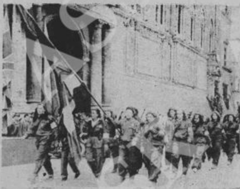
Le Volontarie della Libertà sfilano a Bologna.