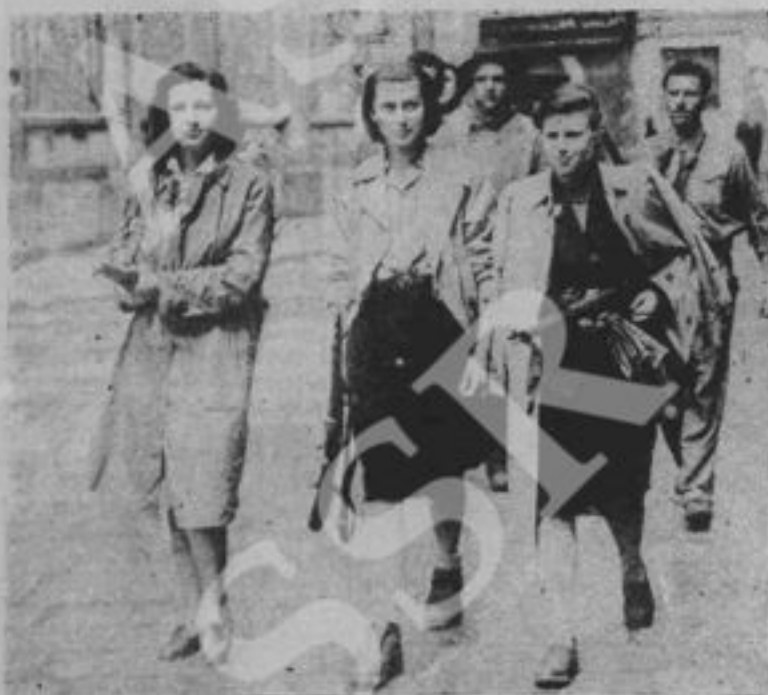
Belle e fiere fanciulle di Milano.

L'unione di tutte le donne, la salda organizzazione ha vivificato, moltiplicato lo slancio, l'abnegazione, l'eroismo di ognuna e ha portato alla gloria dell'insurrezione finale.