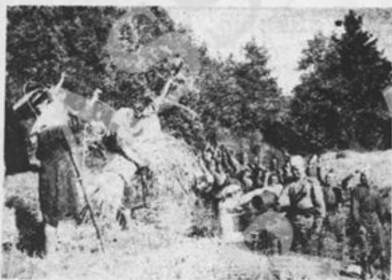
In Ungheria e Romania, liberate dall'esercito sovietico, la terra è stata data a chi la lavora, ai contadini e ai patrioti che hanno lottato per liberarla.