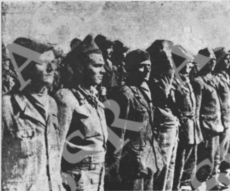
Ecco i Garibaldini reduci dalla Jugoslavia. Per l'onore, la salvezza d'Italia hanno combattuto e anelano di combattere ancora.