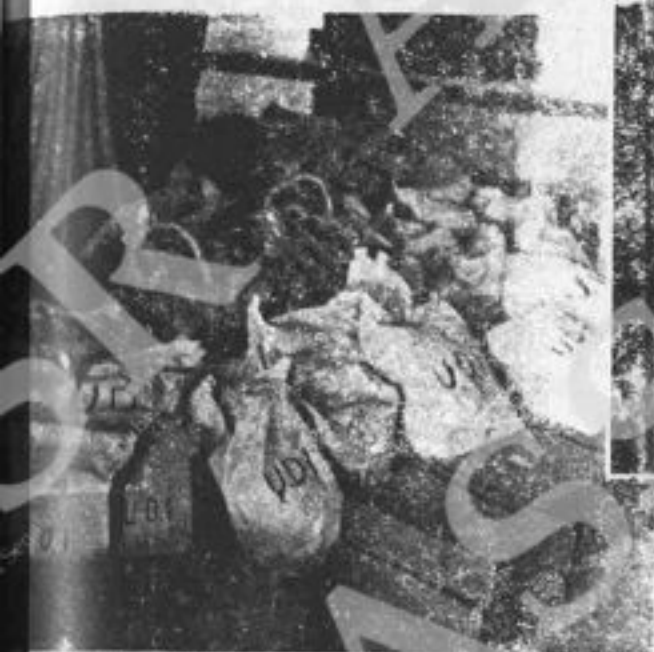
I pacchi dell'U.D.I.