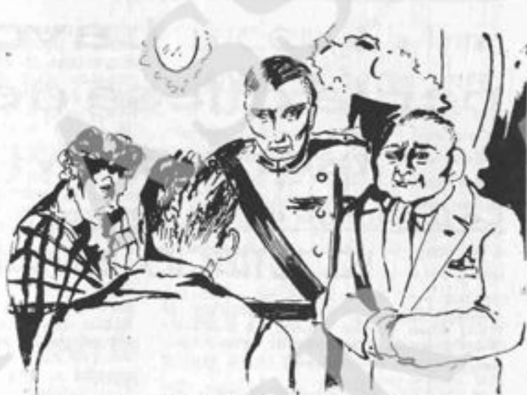
Lo sguardo di Corell era carico d'odio

Il colonnello Lanser gli lanciò una rapida occhiata, ma non parlò. In quel momento la porta a destra si aprì e Annie dai capelli color paglia e dagli occhi arrossati,