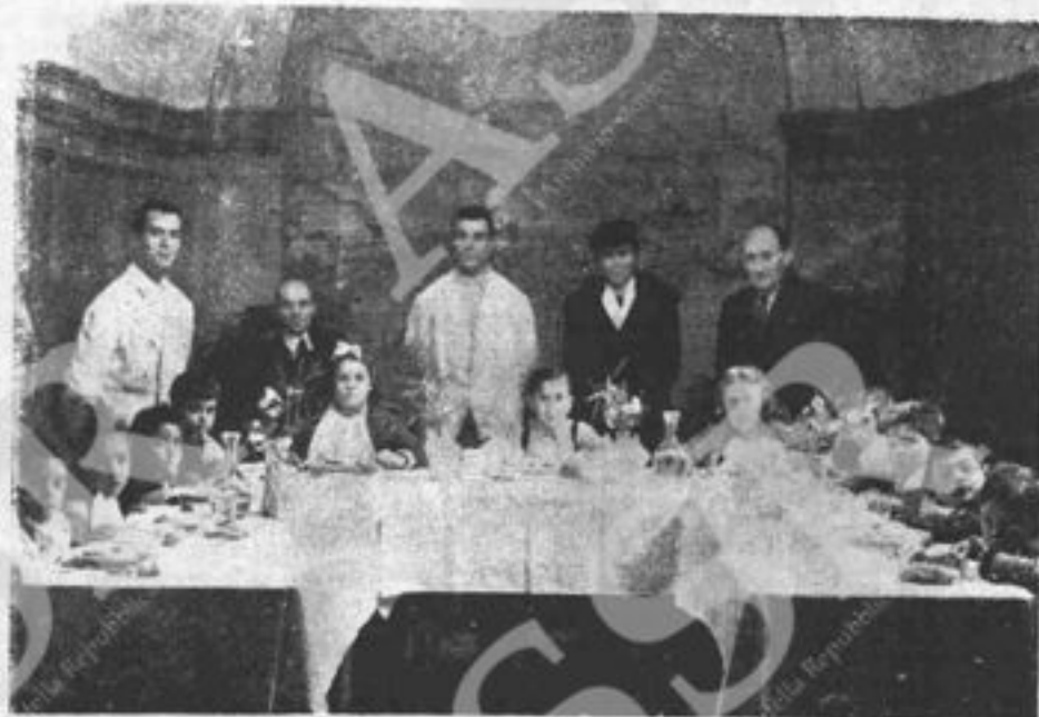
Il pranzo organizzato dal circolo Colonna dell'Unione delle Donne Italiane nella trattoria il Bottaro in via Passeggiata di Ripetta Roma.

A cura dell'Amministrazione ogni ricoverato ebbe una somma di danaro, e poi dolci, giornali e sigarette, quest'ultime offerte in parte dall'U.D.I.