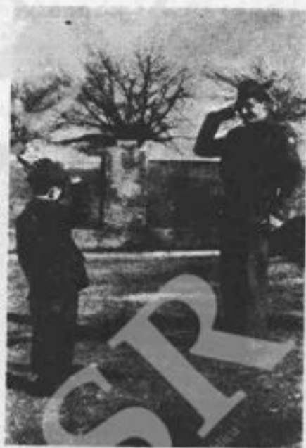
Il « bocca » e il « vecio »

E sapete come il « bocca » è divenuto la mascotte della compagnia? C'era un alpino sempre triste e cupo di umore; non lo rallegravano nemmeno i moti dei compagni o il vinetto dei castelli; pensava al suo bimbo solo, rimasto da poco senza mamma, in un