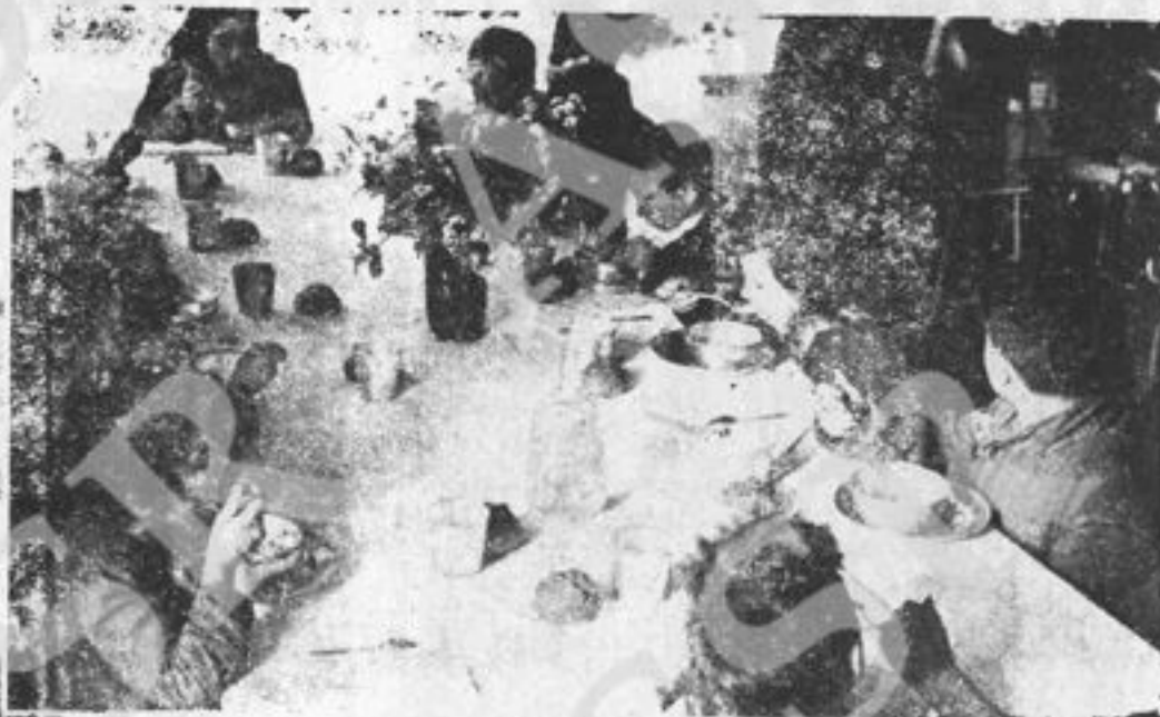
Uno dei pranzi organizzati dal circolo Italia - Roma.