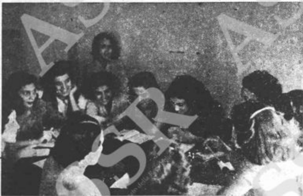
In un'intima, affettuosa collaborazione, dopo il lavoro o la scuola, giovani studentesse ed operaie studiano scambiandosi le loro esperienze. [Circolo S. Saba - Roma]

Però... però la guerra non è finita: ancora tanti miei fratelli lottano, patiscono e muoiono; ancora tante città sono distrutte, ancora tante terre sono sconvolte dalla furia devastatrice. Ho il diritto di dimenticare tutto ciò solo perchè non mi riguarda più da vicino?