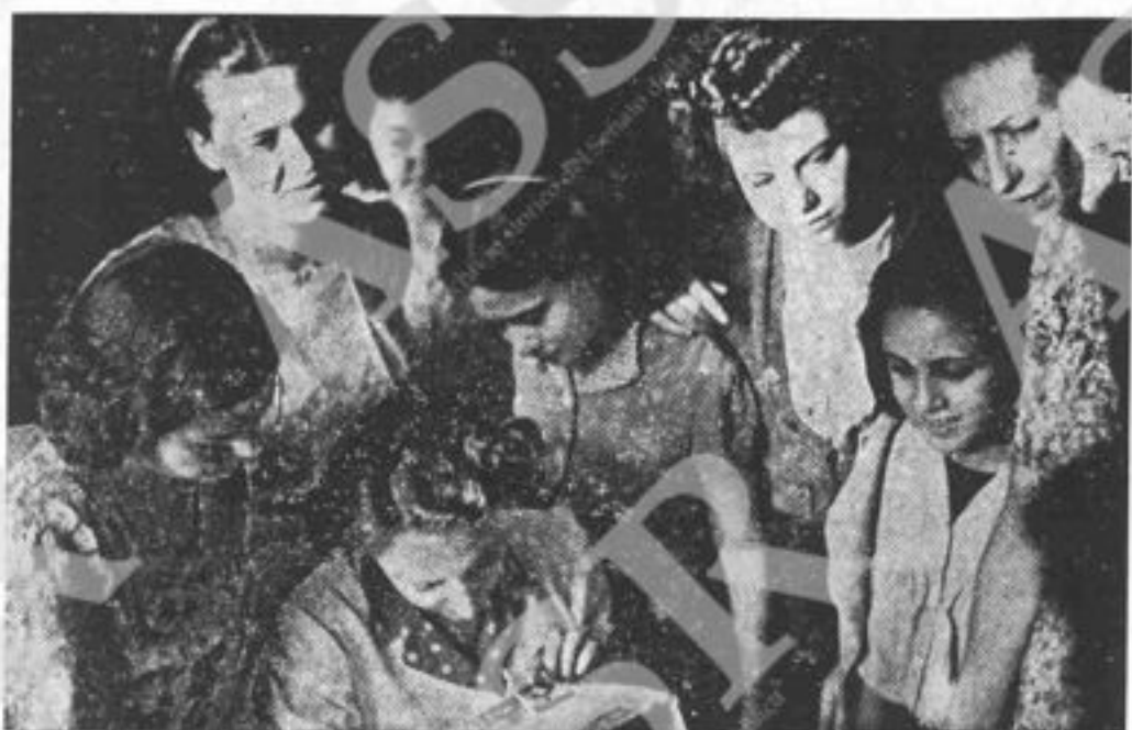
Nel nuovo clima di libertà, ansiose di dare il loro contributo alla rinascita della Nazione, le Ragazze d'Italia si interessano agli avvenimenti del giorno.

Preso da questi due opposti sentimenti, non so decidermi; perciò mi rivolgo a te e ti chiedo: posso ballare?»