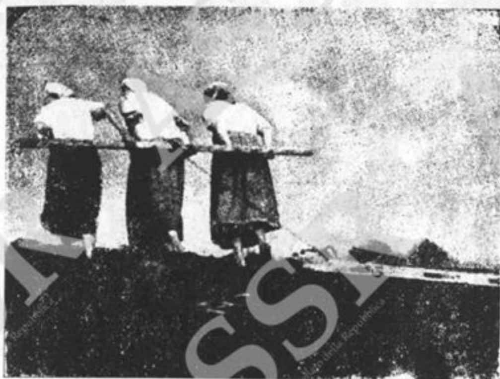
Donne che arano. Dal film "Battaglia per l'Ucraina".