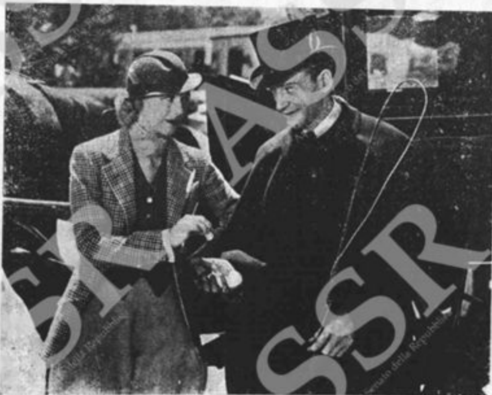
Ginger Rogers e Fred Astaire in "Follie d'inverno".