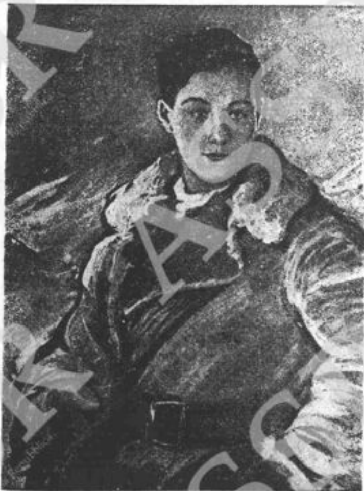
Zola Kosmodemianskaia, partigiana di venti anni, la più grande eroina dell'Unione sovietica, torturata e trucidata dai Tedeschi.

Diffondete la nostra Rivista nei mercati, all'uscita degli uffici, delle fabbriche, delle Amministrazioni. Sottoscrivete e fate sottoscrivere a "NOI DONNE", ritirando le schede a Via IV Novembre 144, Roma. Iniziate subito la campagna per gli abbonamenti.