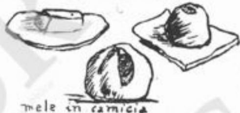
mele in camicia

MELANZANE SECCHE. Tagliare le melanzane in dischi rotondi e infilarle in uno spago. Farle seccare all'aria e al riparo della polvere. Quest'inverno faranno un ottimo condimento, come i funghi secchi.