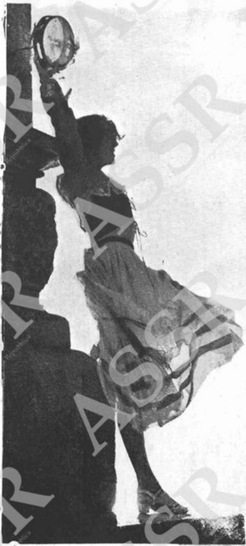
TARANTELLA A CAPRI