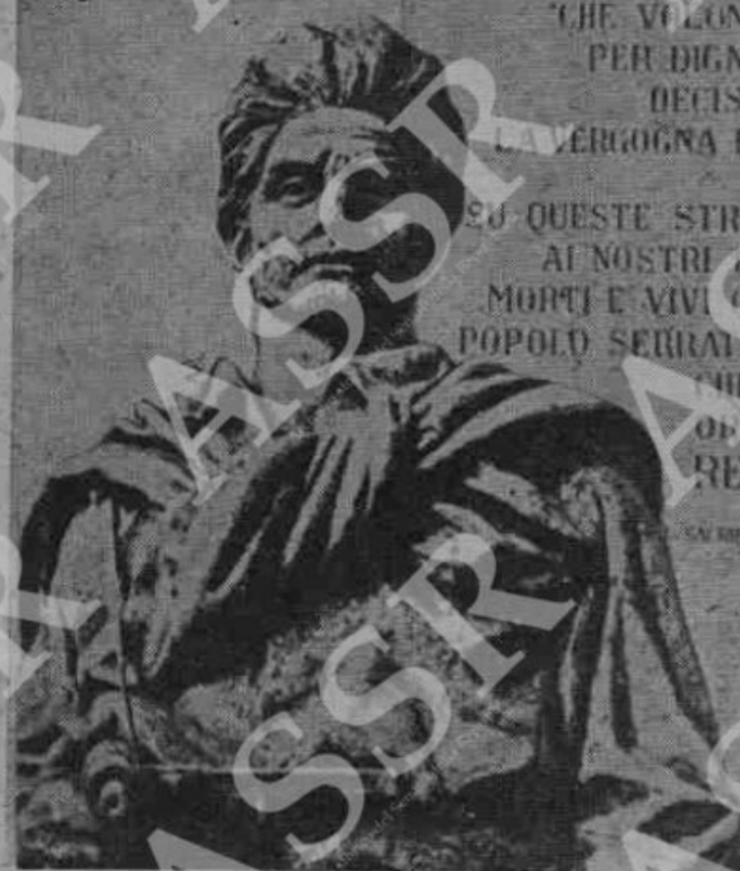
Lapide dedicata al maresciallo Kesserling e particolare del Monumento al Partigiano

IN COLLABORAZIONE CON L'OFFICINA DI SCULTURA "L'ARTISTICO" - TORINO