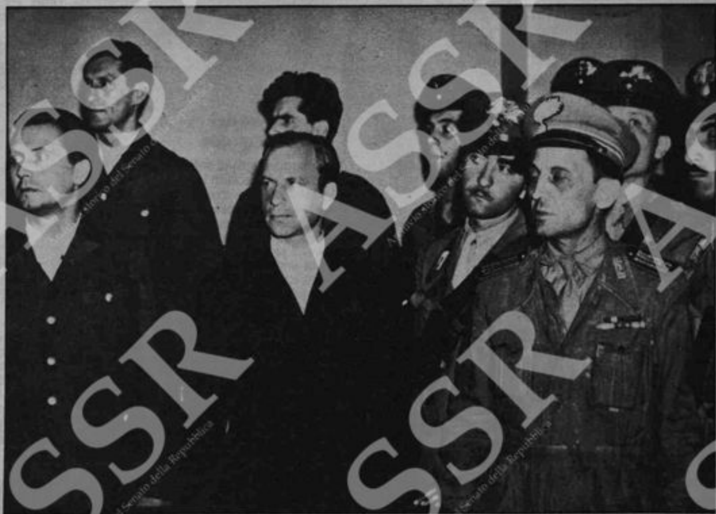
A KAPPLER LA VENDETTA COSTÒ L'ERGASTOLO Roma, luglio 1948. Herbert Kappler, secondo da sinistra in primo piano, durante il processo che lo portò all'ergastolo. Dopo l'attentato di via Rasella fu Kappler, allora tenente colonnello delle SS, a eseguire la «vendetta» delle Ardeatine. È morto il 9 febbraio '78, sei mesi dopo la fuga dall'ospedale del Celio.