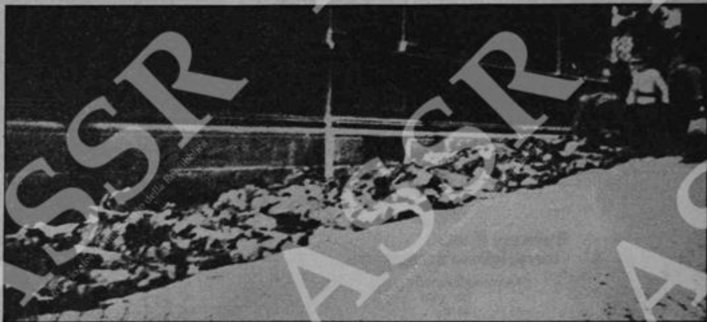
MORIRONO 33 TEDESCHI Roma, 23 marzo 1944. In questa rara immagine, la fila dei 33 soldati del battaglione «Bozen» rimasti uccisi in via Rasella. Diciotto chili di tritolo vennero fatti esplodere da Rosario Bentivegna travestito da netturbino. All'azione parteciparono anche Franco Calamandrei e Carla Capponi (che poi sarebbe diventata la moglie di Bentivegna), con l'appoggio di altri nove partigiani.

«No. Per ragioni di fatto, ragioni di diritto, ra-