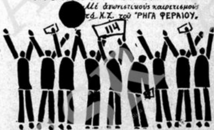
Manifesto murale dell'organizzazione studentesca RIGAS FERREOS in occasione della ricorrenza del colpo di Stato. Il testo invita gli studenti alla lotta.

ΣΤΙ ΑΠΡΙΑΗ 69 — Η ΕΛΛΑΔΑ ΜΑΣ ΚΛΕΙΝΕΙ ΕΝΑ ΑΚΟΜΑ ΧΡΟΝΟ ΚΑΤΩ ΑΠ' ΤΗ ΜΠΟΤΑ ΤΩΝ ΣΤΥΓΝΩΝ ΔΙΚΤΑΤΩΡΩΝ ΕΜΕΙΣ ΟΙ 6ΠΟΥΘΑ6ΤΕΣ ΒΘΟΥΤΟ6ΩΥΑ6ΟΥΜΕ: ΚΑΤΩ Η ΤΥΡΑΝΝΙΑ ΕΙΩ ΟΙ ΛΗΠΕΡΙΑΛΙ6ΤΕΣ — ΠΡΟ6Α6ΕΙΣ ΕΛΕΥΘΕΡΗ ΚΑΙ ΔΗΜΟΚΡΑΤΙΚΗ ΠΑΙΔΕΙΑ ΕΜΕΙ ΟΙ 6ΠΟΥΘΑ6ΤΕΣ ΑΥΩΝΙ6ΟΥΜΑ6ΤΕ ΓΙΑ ΤΗ ΝΕΑ, ΤΗ ΛΕΥΤΕΡΗ, ΤΗ ΔΗΜΟΚΡΑΤΙΚΗ ΚΑΙ ΑΥΤΑΡΧΙΚΗ ΕΛΛΑΔΑ ΟΛΟΙ 6ΤΗΝ ΑΥΤΙ6ΖΑ6Η! ΟΛΟΙ 6ΤΙ6 ΣΡΑΜΕ6 ΤΟΥ ΨΗΦΙΑ. ΕΜΠΡΟ6Ι6Α6 ΧΤΙ6ΟΥΜΕ ΤΟ ΣΡΑΥΛΤΕΝΙΟ ΚΕΤΩΠΟ ΤΩΝ 6ΠΟΥΘΑ6ΤΩΥ ΦΟΛΤΗΤΕ6 — 6ΠΟΥΘΑ6ΤΕ6 ΑΥΑ6ΤΕ ΠΑΥΤΟΥ ΤΗ 6ΠΙΘΑ ΤΗ6 ΛΕΥΤΕΡΙΑ6