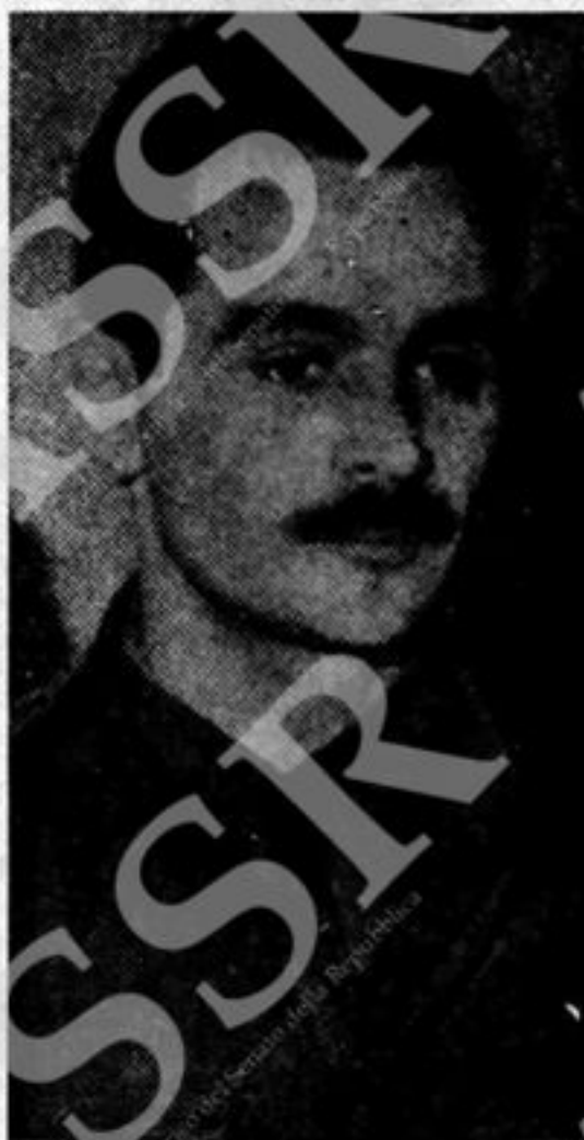
L'EROE DELLA RESISTENZA GRECA ALEKOS PANAGULIS