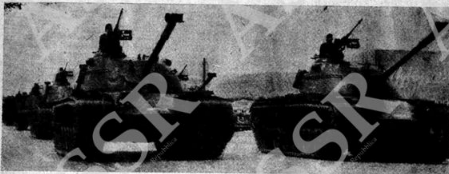
Nel due anni di dittatura fascista i colonnelli non sono riusciti ad ottenere il minimo appoggio popolare. La loro forza si basa sui carri armati degli USA e della NATO.

In ambedue i casi però — elezioni o nomina — la procedura è la stessa. Si compila cioè un elenco con i nomi dei possibili candidati alle elezioni o alla nomina; questo viene consegnato alla polizia e, successivamente, al comando Militare, che a sua volta decide, a seconda dei casi, chi può essere incluso nella lista dei candidati alle elezioni, oppure chi può essere nominato a far parte del Direttivo. Nel caso di svolgimento di elezioni esse hanno luogo sotto il rigido controllo della polizia ».