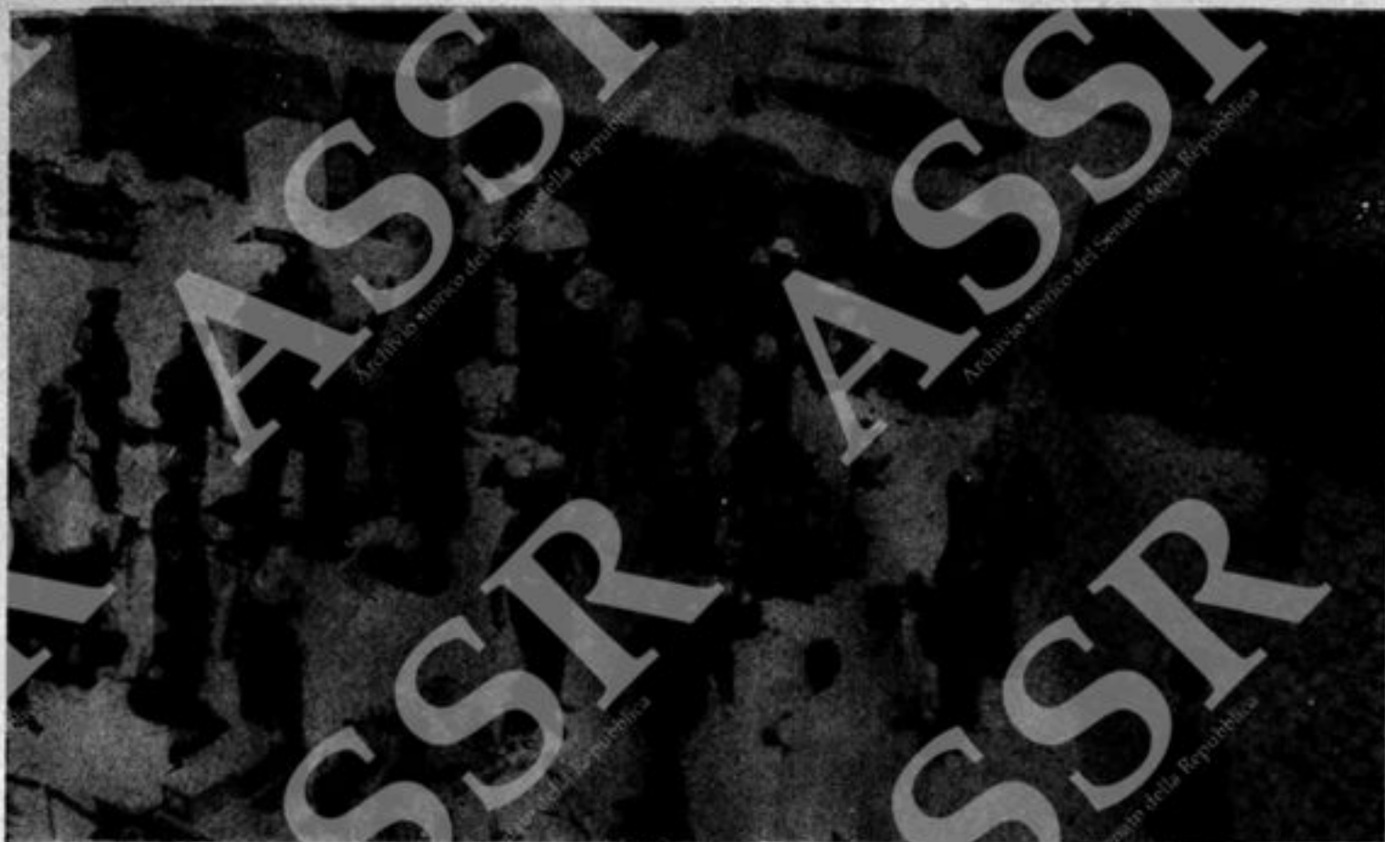
Un gruppo di prigionieri politici nel porto di Pireo in attesa di essere imbarcati per il luogo di deportazione nelle isole dell'Egeo.